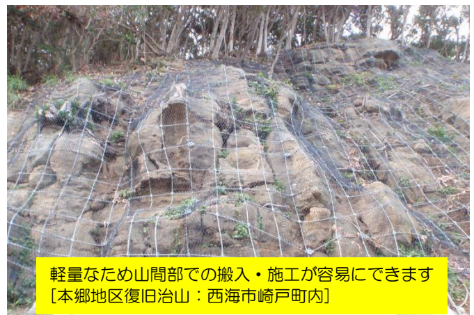
軽量なため山間部での搬入・施工が容易にできます [本郷地区復旧治山 : 西海市崎戸町内]