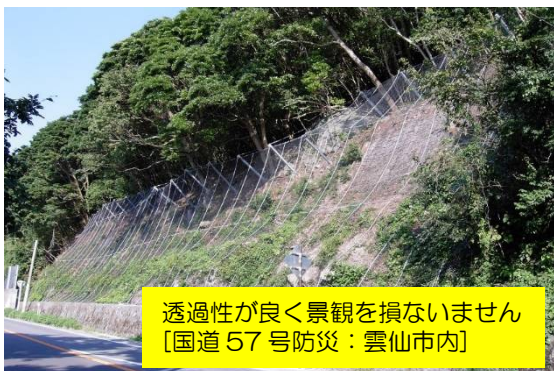
透過性が良く景観を損ないません [国道 57 号防災 : 雲仙市内]