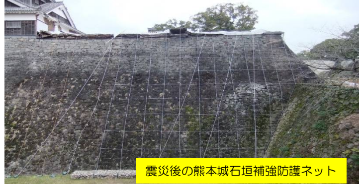
震災後の熊本城石垣補強防護ネット