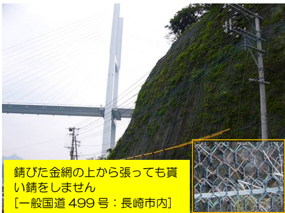
錆びた金網の上から張っても 錆をしません [一般国道 499 号 : 長崎市内]